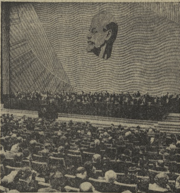
Москва. XXIII съезд Коммунистической партии Советского Союза.

Вывод первого искусственного спутника на орбиту вокруг Луны — новая выдающаяся победа советских ученых, инженеров и рабочих. Наша страна, создавшая в 1957 году первый искусственный спутник Земли, ныне вывела первый искусственный спутник на орбиту вокруг Луны, что является важным этапом в ее исследовании.