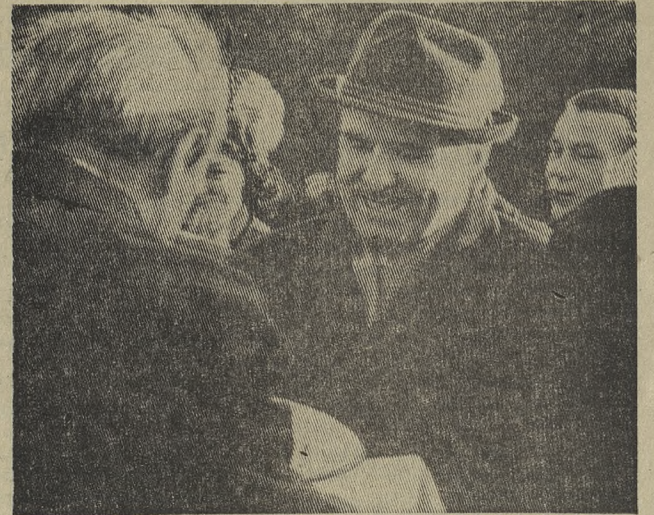
Редактор С. И. ЛЕКАНОВ.