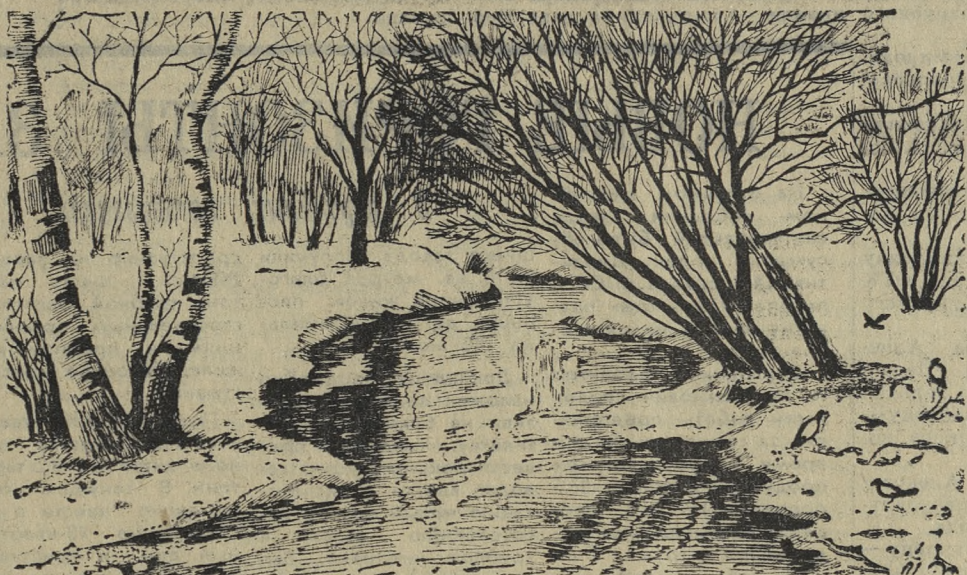
Весенний пейзаж. Рисунок М. ХРОМЦОВА.

М. ХОМЕНКО, член общественного совета при детской комнате милиции.