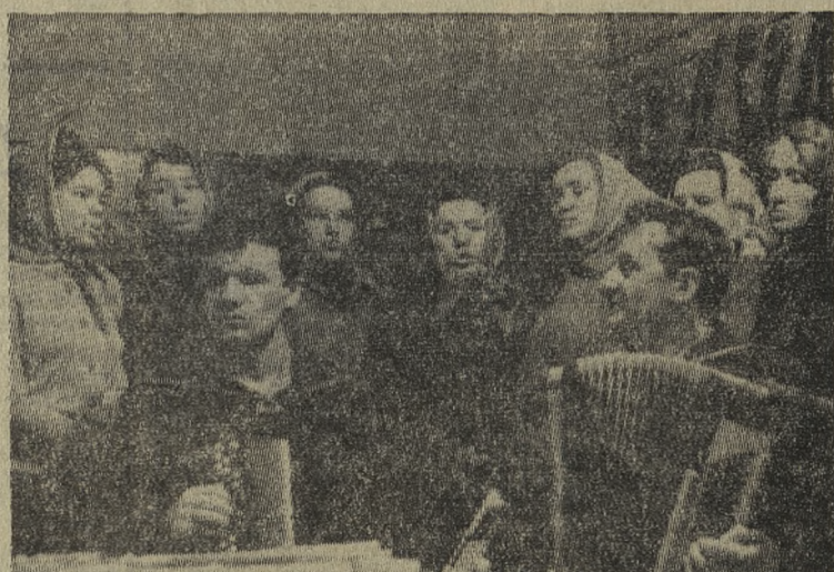
Прокатчики умеют не только отлично трудиться, но и отдыхать. Популярностью на предприятии пользуется самодельность цеха «Т-5». Наш фотокорреспондент А. Кадочников побывал у самодельных артистов.

На первый взгляд трудно определить ценность этих мероприятий. Но возьмем только одно — увеличение стойкости еалков прошивного стана с помощью наплавки. В случае осуществления его за год будет выпускаться дополнительно по несколько тысяч тонн продукции.