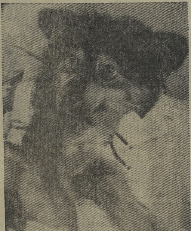
Собака Уголек, которая совершила двадцатидвухдневный полет на корабле «Космос-110», после прибытия в Москву.