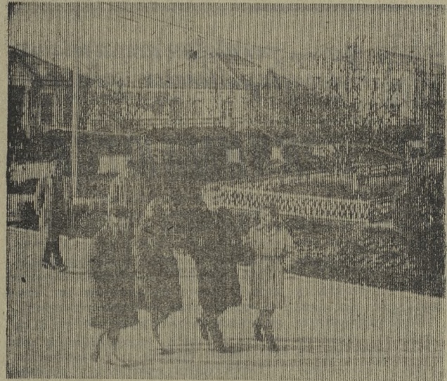
ИЗ ЗАЛА СУДА

За последнее время на широких прямых улицах выстроились ряды новых домов, обрамленных садами и цветниками. На снимке: одна из улиц поселка совхоза «Красноармейский».