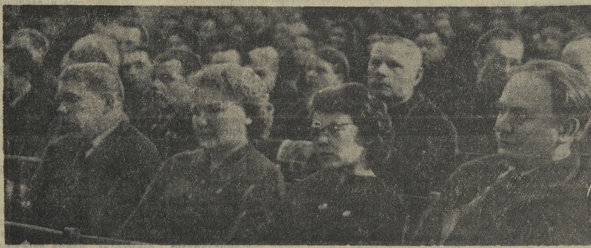
На снимке: участники городского собрания.

И еще — плохое качество стальных изделий. Девушка-технолог на заводе железобетонных изделий и конструкций, видимо, молодой специалист, пыталась убедить меня, что это неизбежно. Как будто бы мы не встречались с этим злом. На это скажу одно: при обработке древесины следует строго придерживаться установленных ГОСТом правил. И тогда все будет в порядке.