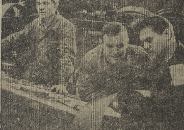
К весне готовиться сейчас