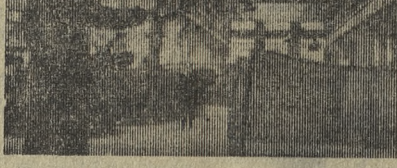
В Запорожье вошла в строй первая очередь завода железобетонных труб и опор линий электропередач. Проектная мощность первой и второй очереди предприятия — 48 тысяч кубометров специальных железобетонных изделий в год.

Ухудшение положения интервентов сказалось на американском общественном мнении: оно все настойчивее требует прекращения войны в Азии. Только на днях состоялся поход в Вашингтон под девизом «За мир во Вьетнаме», в котором, по сведениям печати, приняло участие более 50 тысяч человек. А до этого, как известно, в Вашингтоне перед Белым домом и в Нью-Йорке перед зданием ООН сожгли себя в знак протеста против агрессии во Вьетнаме два американских пацифиста. В Белый дом идут тысячи писем, в которых американские матери проклиная-