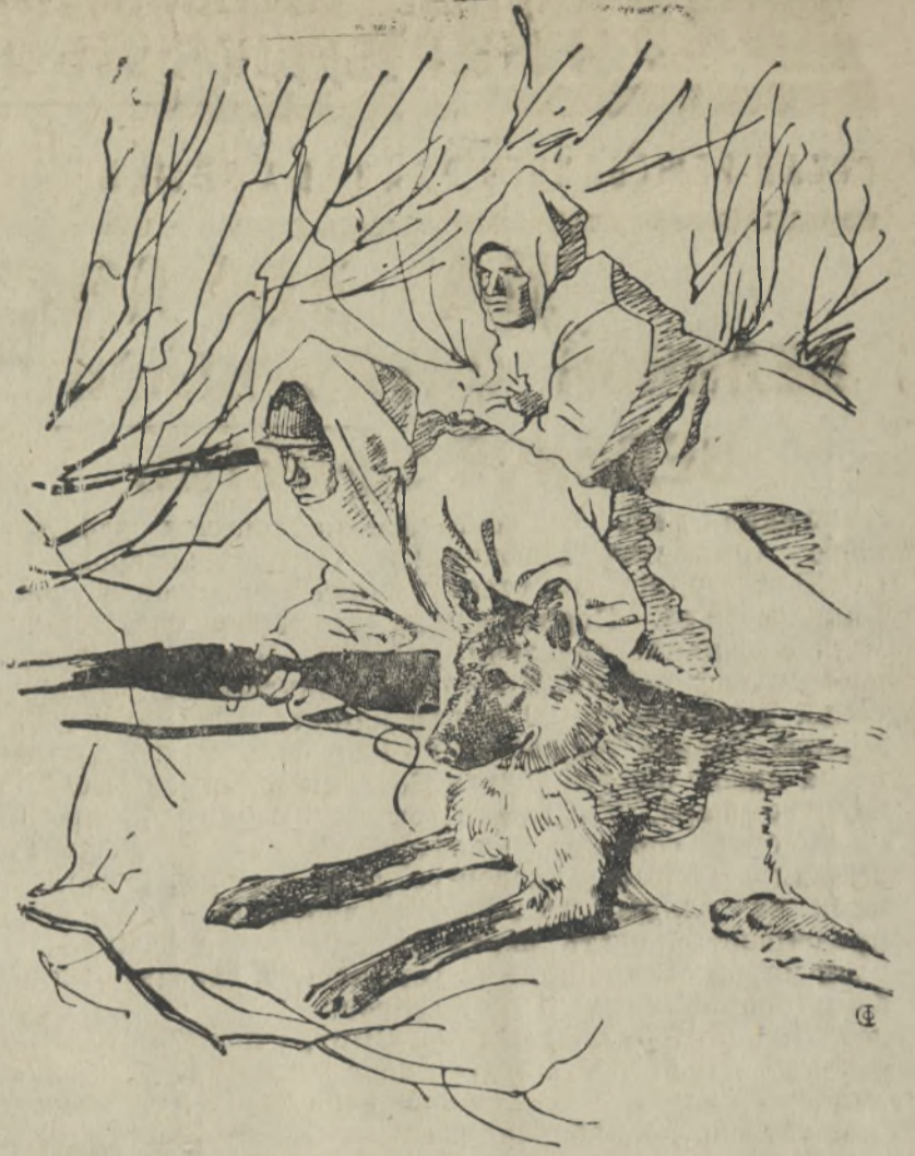
На страже советских границ. Бойцы-пограничники в секрете

„Перелом в наших частях начался. За неделю не было у нас ни одного случая частичных или групповых перебежек. Дезертиры возвращаются тысячами. Перебежки из лагеря противника в наш лагерь участились. За неделю к нам перебежало человек 400, большинство с оружием. Вчера днем началось наше наступление. Хотя обещанное подкрепление еще не получено, стоять дальше на той же линии, на которой мы остановились, нельзя было — слишком близко до Питера. Пока что наступление идет успешно, белые бегут, нами сегодня занята линия Керново — Воронино — Слепино — Касково. Взятые нами пленные, 2 или больше орудий, автоматы, патроны. Неприятельские суда не появляются, видимо боится „Красной горки“, которая теперь вполне наша . . .“