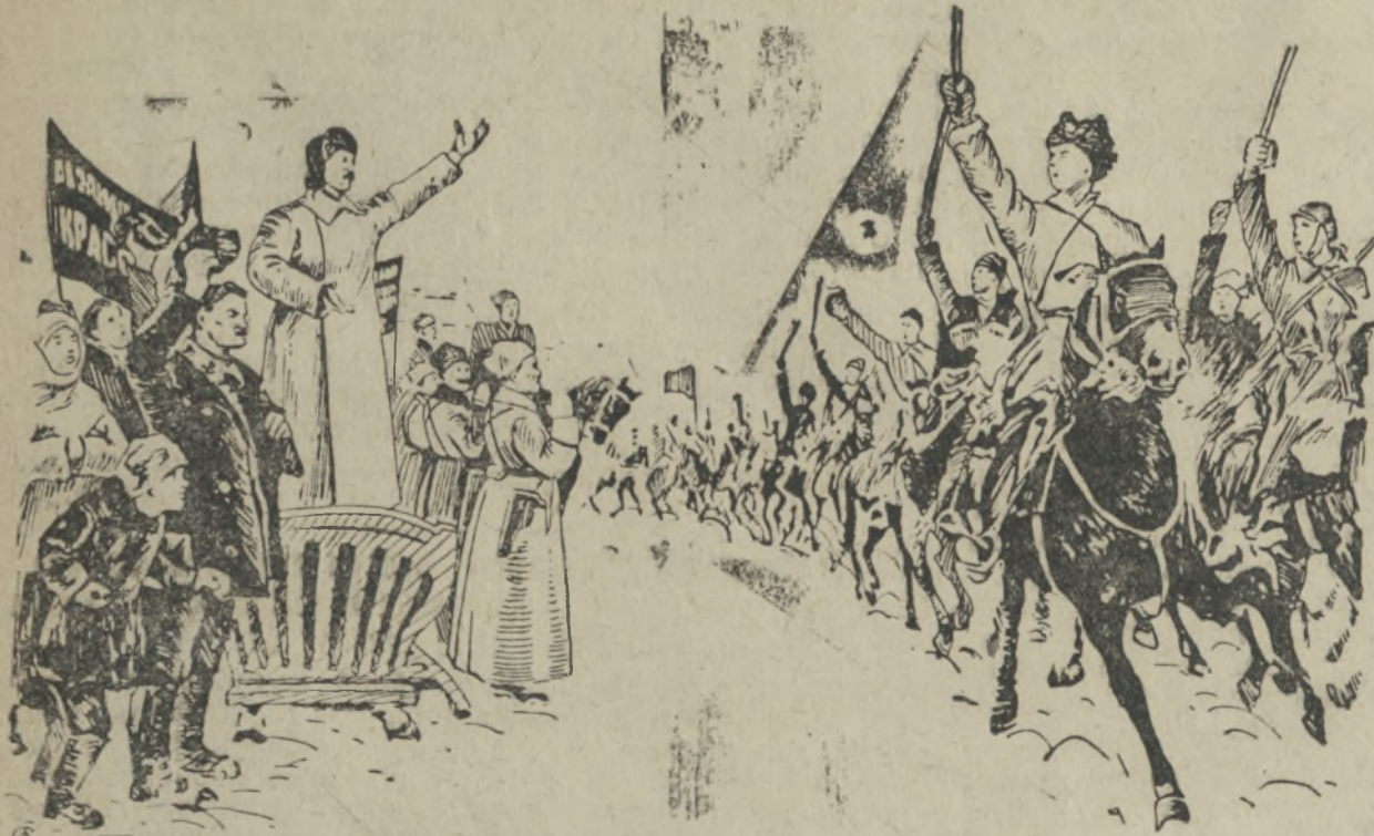
Товарищ И. В. Сталин в 1-й конной армии.

(Из жур. „В помощь районной газ.“ № 13 за 1937 г.)