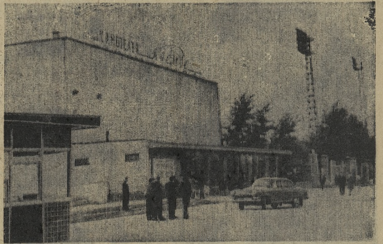
НА СНИМКЕ одно из любимых мест отдыха трудящихся Первоуральска — кинотеатр «Космос».

Л. КОХМАН, работник Новотрубного завода.