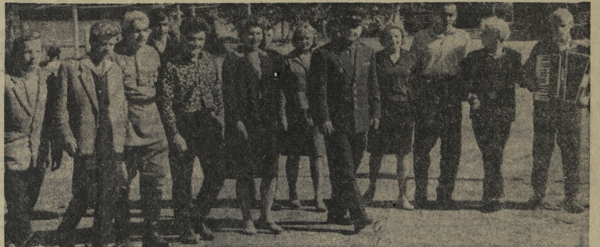
НА СНИМКЕ: призывники и провожающие их — родные, представители общественности.