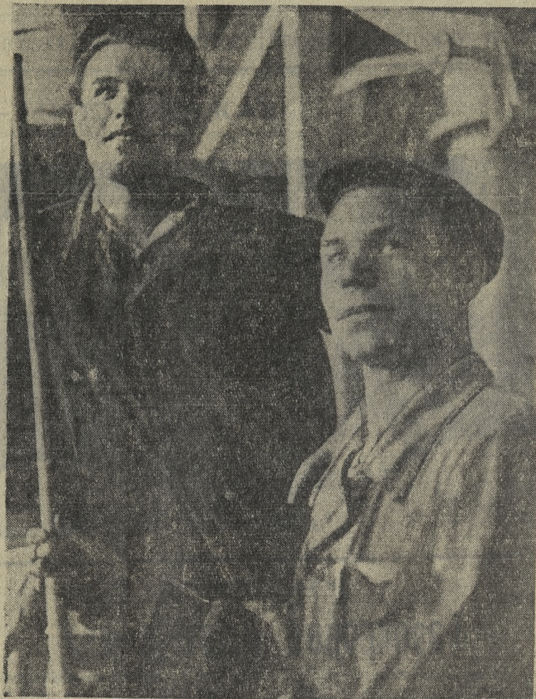
К 25-ЛЕТИЮ ТРУДОВЫХ РЕЗЕРВОВ

Под знаменем Ленина 5 сентября 1965 г., № 176