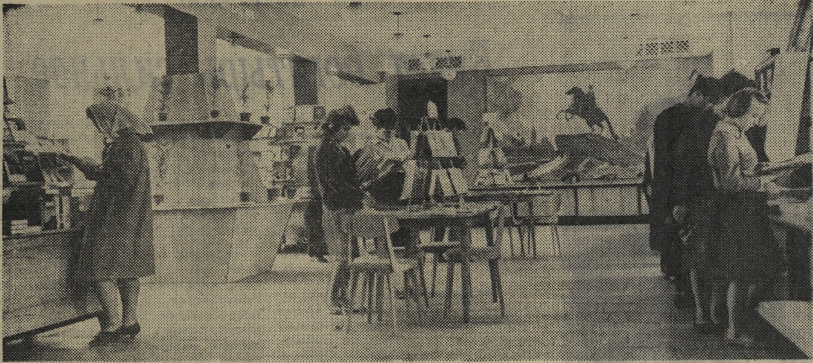
«Книжный мир» — так называется новый книжный магазин, открытый в Нижнем Тагиле.