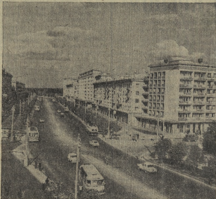
Минск. Новые жилые дома на центральной магистрали города—Ленинском проспекте.