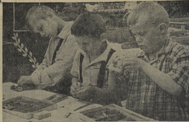
Юные конструкторы.