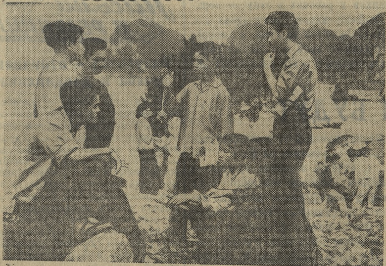
ДЕМОКРАТИЧЕСКАЯ РЕСПУБЛИКА ВЬЕТНАМ. Школьники на берегу залива Алон.