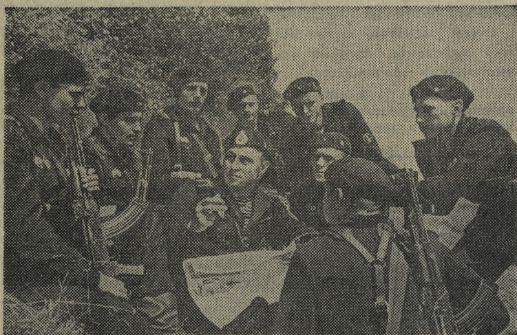
Офицер-политработник проводит беседу с воинами морской пехоты.