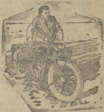
В. Г. Полняков об'езжает свой участок на мотоцикле.