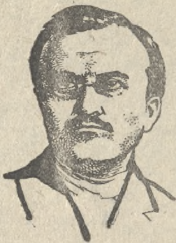
В. М. МОЛОТОВ

Товарищи, настоящая конференция собралась на историческом рубеже: 1932 год—год завершения первой пятилетки и подготовки к осуществлению второго пятилетнего плана.