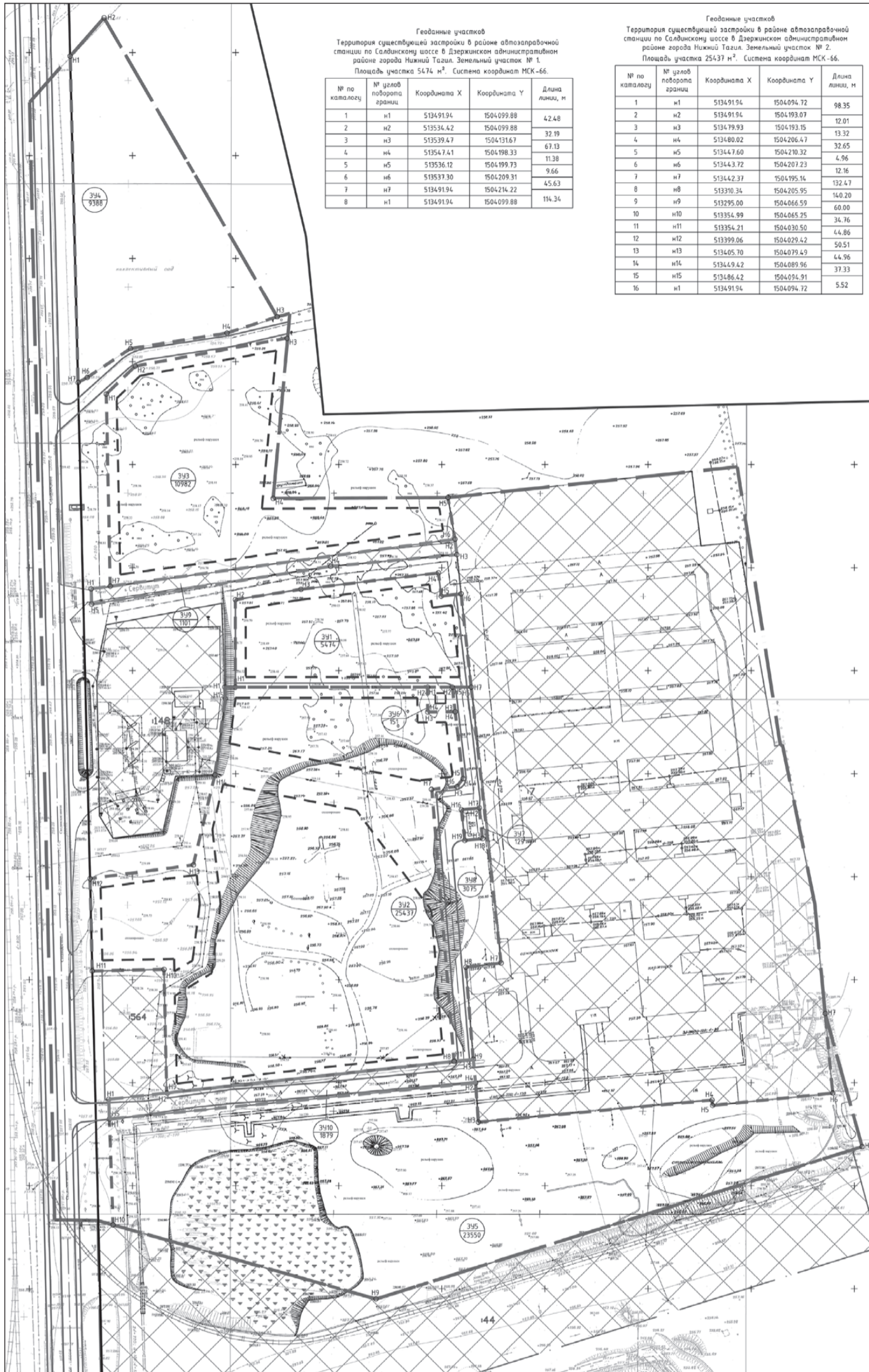
Геодаанные участков Территория существующей застройки в районе автозаправочной станции по Салдинскому шоссе в Дзержинском административном районе города Нижний Тагил. Земельный участок № 1. Площадь участка 5474 м 2 . Система координат МСК-66.