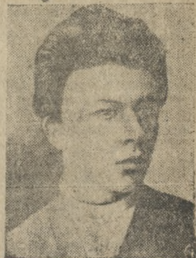
Александр Ильич УЛЬЯНОВ брат В. И. ЛЕНИНА. К 50-ти летию со дня жизни. (20 мая 1887—1937 г.)