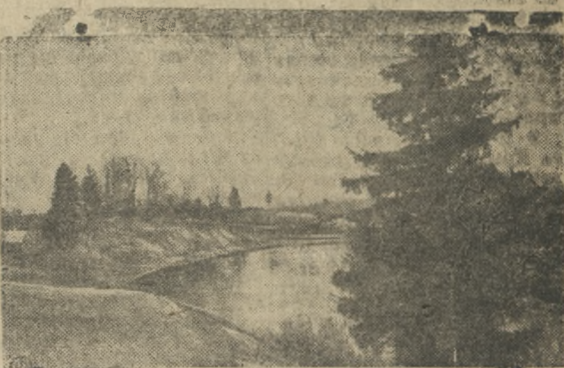
На си: Рена Лопань после ледохода. На- линская область.

Как сообщают из Испании, глава испанского правительства республикан Ларго Кабальеро уведомит президента Асанья об отставке правительства. Асанья начал переговоры об образовании нового правительства. Отставка правительства Ларго Кабальеро вызвана, по видимому, необходимостью образовать более сильное правительство с тем, чтобы выполнить задачи, связанные с ведением продолжительной войны, и событиями в Каталонии. Анархосиндикалистическая национальная конфедерация труда и всеобщий рабочий союз сообщили, что Ларго Кабальеро должен будет возглавить новый кабинет. Генеральный секретарь компартии Испании Хосе Диас рекомендовал образовать правительство народного фронта с участием профсоюзов, в котором таким образом будут представлены все антифашистские силы.