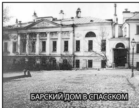
БАРСКИЙ ДОМ В СПАССКОМ

Нанятые учителя – иностранцы, как это было принято тогда в дворянских семьях, учили юного барина тем дисциплинам, которые открывали двери в лучшие высшие учебные заведения. А первым его учителем русского языка был крепостной крестьянин, исполнявший обязанности секретаря у матушки. Мужик, видно, хорошо владел грамотой и привил любовь молодому барину к родному слову, к яркой, образной народной речи. Позднее великий критик Виссарион Белинский скажет о И. Тургеневе: «Необыкновенный поэтический талант».