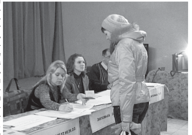
Во время работы на избирательном участке

зий к участковым избирательным комиссиям, не выявили нарушений избирательного кодекса. Жалоб и обращений не поступало.