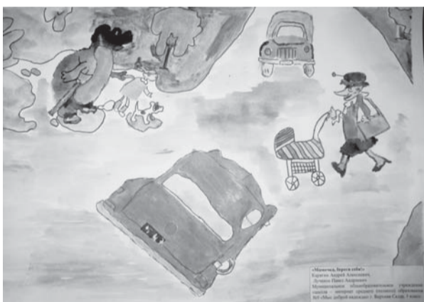
«Мамочка, береги себя!» Рис. Андрея Карагяна и Павла Лученка, школа №9, 3 класс

В связи ростом детского дорожно-транспортного травматизма с 22 февраля по 05 марта 2010г. прошел 1 этап городского творческого конкурса рисунков по безопасности дорожного движения, объявленный Управлением ГИБДД по Свердловской области и Министерством общего и профессионального образования. В конкурсе приняли участие учащиеся школ города от 8 до 13 лет. Конкурс проводился по следующим номинациям: «Дорожно-патрульная служба-служба для настоящих мужчин», «Мой папа – водитель. Он соблюдает ПДД», «Мамочка, береги себя!», «Правила движения – основа дорожной грамоты», «Нарушать ПДД - опасно и глупо».