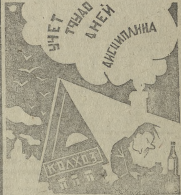
Рисунок В. А. Карташева

Выдача авансов производилась по принципу кулацкой уравниловки—всех под одну мерку и благодаря этому честные колхозники ударники, хлеба и денег не получили. На 1 декабря 1931 года выдано на авансы 199 цент., но учет кому и сколько выдано совершенно отсутствует. Кроме всего сказанного правление израсходовало лошадям 88 цент. и как следствие этого с засыпкой семян дело стоит на точке замерзания.