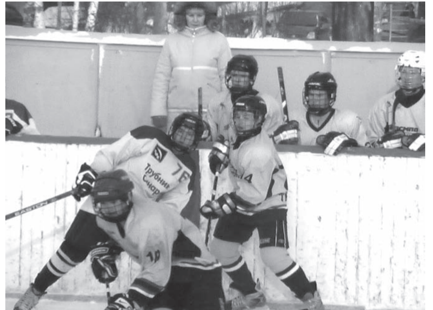
Один из переломных моментов игры