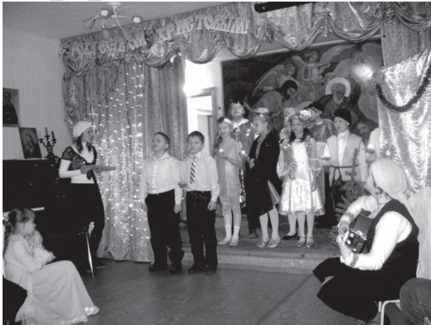
Первое представление прошло 8 января в зале воскресной школы

зыкальное представление о рождении младенца Иисуса. Через песни и танцы библейский сюжет оживился, и присутствующие совершили виртуальное путешествие на 2000 лет назад, в древний Вифлеем. Вместе с волхвами они шли за звездой, чтобы своими глазами увидеть чудо - младенца Христа.