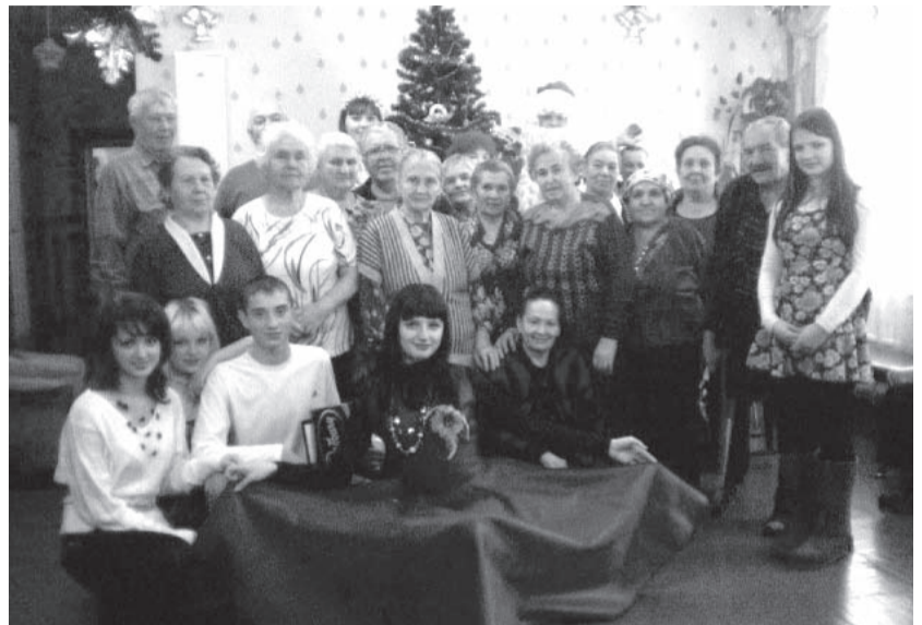
Мы вместе встретили Новый год