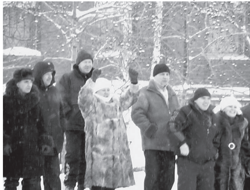
Болеют за своих

7 января на горнолыжном комплексе «Мельничная» соревновались лыжники. Несмотря на 20 градусный мороз, участвовали более ста человек. Лыжня, по мнению спортсменов, сопротивлялась, и из-за холода местами скольжение сильно затруднялось.