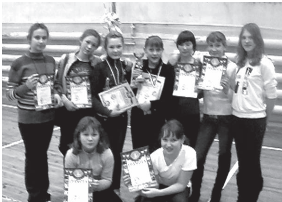
Городская сборная команда девочек «Триумф» - победитель областных соревнований

Впервые за несколько десятилетий в нашем городе была набрана баскетбольная команда девочек. Команда "Триумф", - это девчонки, которым 11-12 лет. Юные баскетболистки тренируются по четыре, а иногда и по пять раз в неделю: в шестой школе, в легкоатлетическом куполе, в спорткомплексе "Чайка". Для такого возраста тренировочных дней много, скажите вы. Трудно не согласиться, на девочек возлагали надежды, но они не оправдали всех ожиданий.