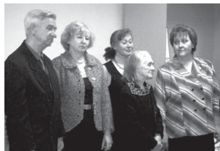
Приятный повод собрал их вместе

Точную дату образования литературного объединения, начавшегося с кружка, сейчас назвать сложно. Стихи салдинцы писали издавна, но первое письменное доказательство - публикации в местных газетах 1944 года. Именно тогда редакция провинциальной газеты из уральской глубинки, выполняя ленинские заветы о вовлечении масс в печатное дело, создала литературную группу.