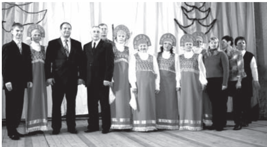
После концерта: участники, спонсоры, руководители

По данным Интернета, в Свердловской области зарегистрировано более 300 тысяч инвалидов, в том числе - 19366 инвалидов Великой отечественной войны и 22 379 - детей-инвалидов.