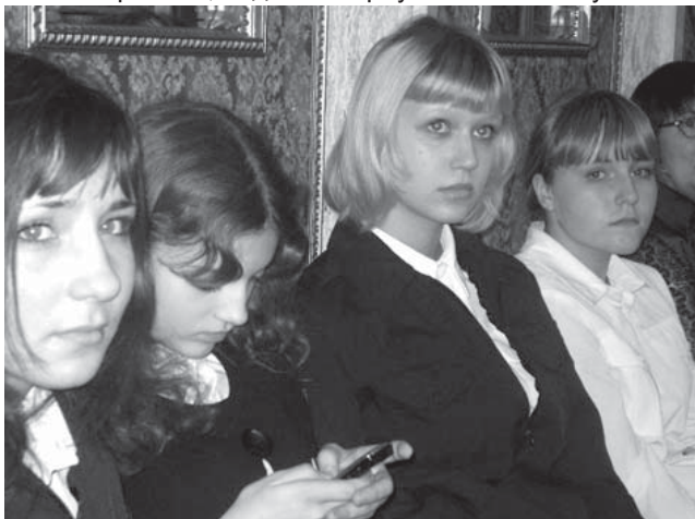
Тема войны и трагедии солдатских судеб близка салдинской молодежи

PS: Все материалы Грумовских чтений силами сотрудников музея оформляются и публикуются в сборниках.