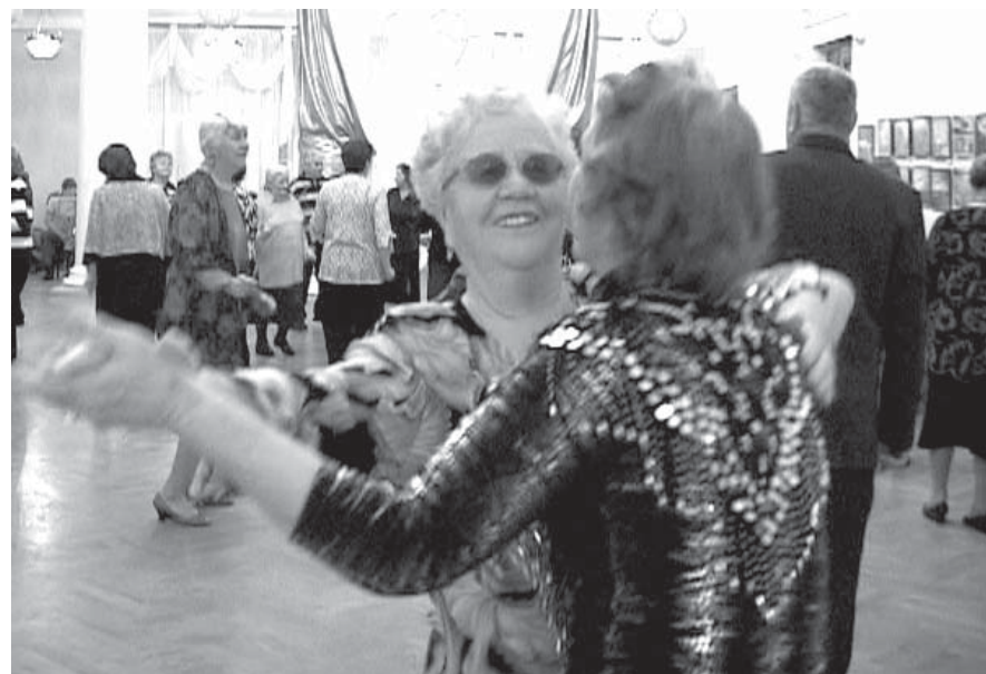
От танца душа молодеет