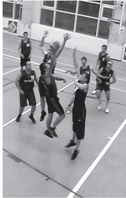
Игровой момент финальной игры

скетболу впервые за много лет заняла второе место! Молодцы!