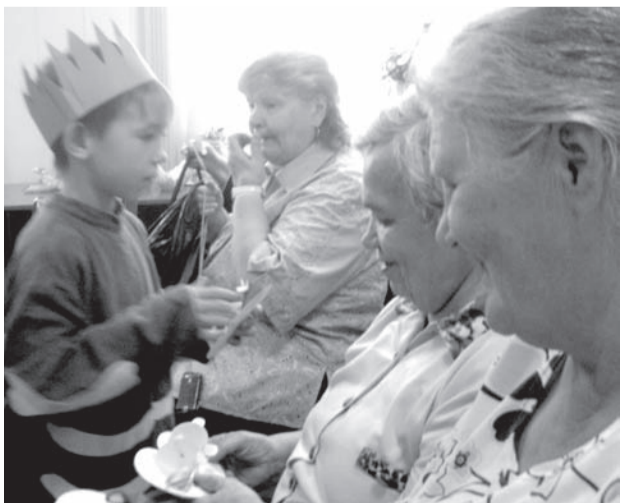
Ребята дарят открытки, сделанные своими руками