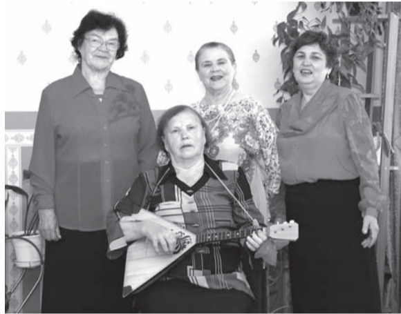
Отдыхающие с удовольствием готовятся к празднику

1 октября – Всемирный день пожилого человека. Раньше этот праздник отмечался в Европе, затем в Америке, а в конце 80-х уже во всем мире. В эти дни теле- и радиопрограммы транслируют передачи с учетом вкусов пожилых людей. Общественные организации и фонды устраивают декады пожилого человека, различные благотворительные акции.