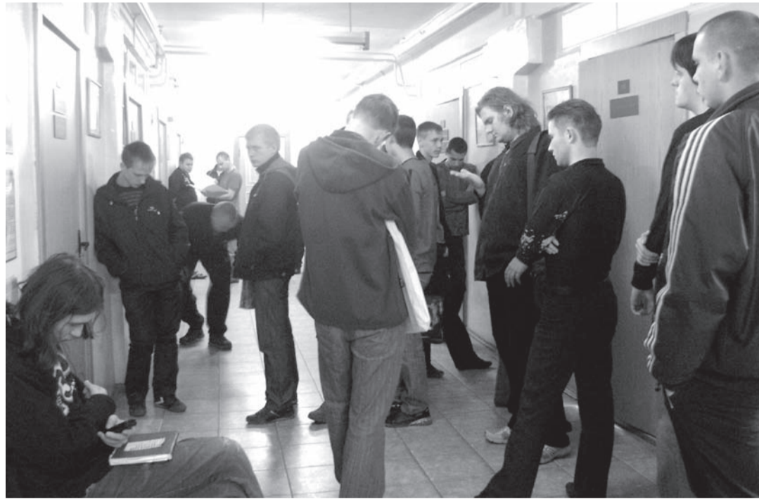
НИЖЕСАЛДИНСКИЕ ПАРНИ ПРОХОДЯТ МЕДИЦИНСКУЮ КОМИССИЮ