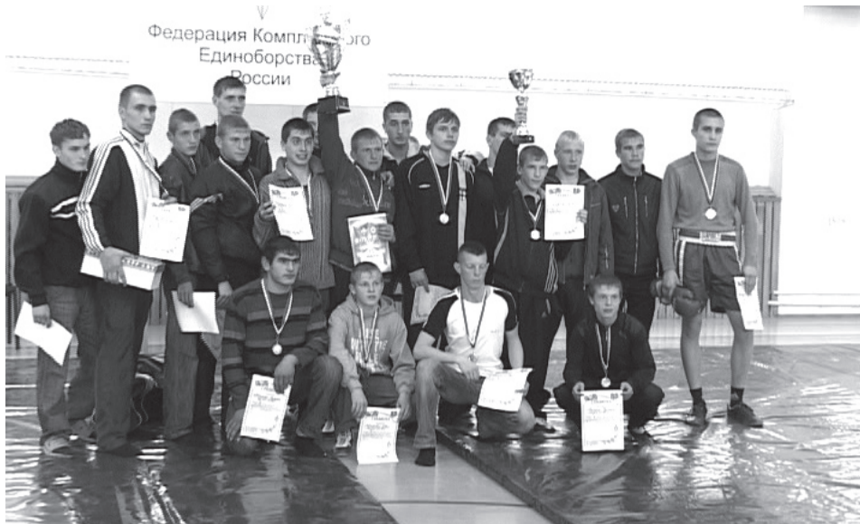
Команда Невьянска завоевала 10 золотых наград

Универсально-полноконтактная версия начала внедряться в Министерстве Обороны Российской Федерации после турнира сильнейших бойцов спецподразделений, который состоялся в Москве в 1992 году. Версия представляет собой своеобразный полигон для испытания эффективности различных приёмов в условиях жесткого противоборства, без защитного снаряжения, в боксёрских перчатках.