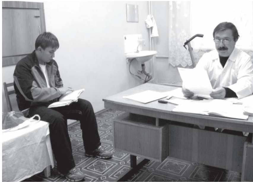
На приеме у врача

Уместно напомнить в настоящей публикации и о том,