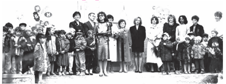
1 СЕНТЯБРЯ 1994 ГОД

Школа задумывалась как локальная инновация, а в процессе получи-