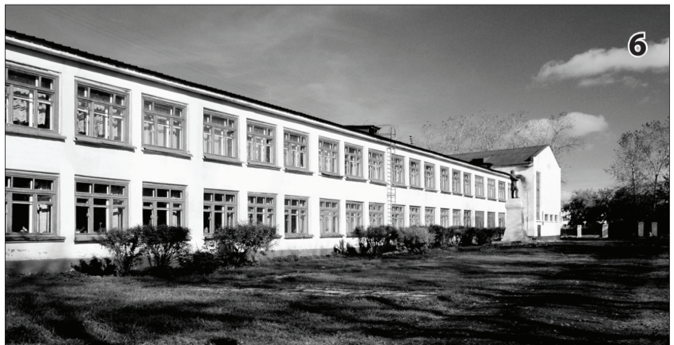
Назовите номер школы?