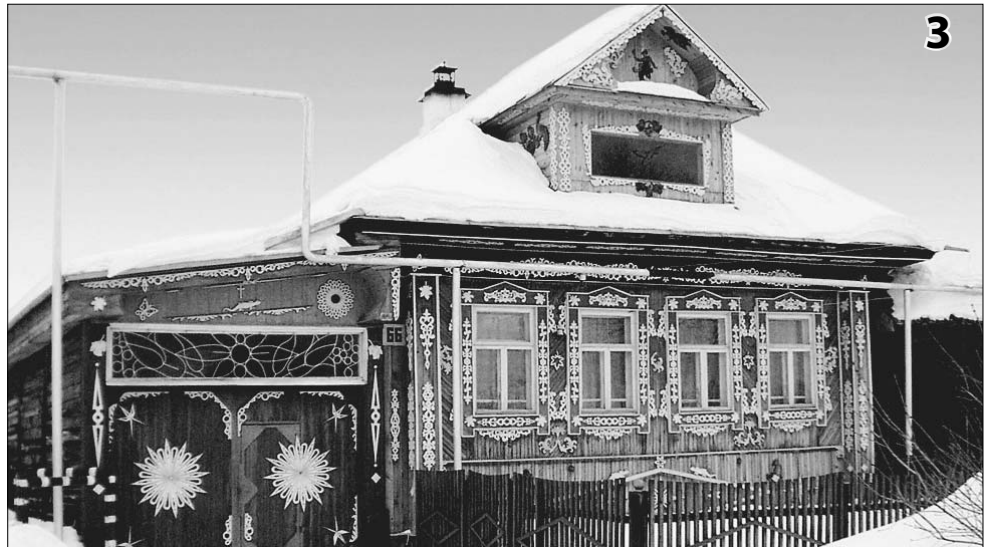
Назовите улицу, на которой находится этот дом