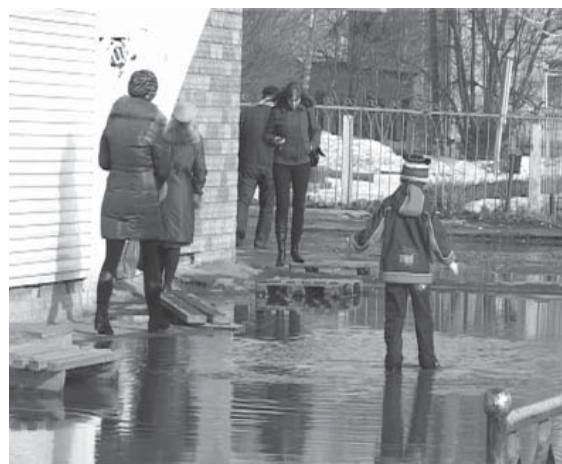
А детям море по колено