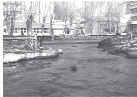
Какой... построил стену