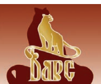
Вятская Меховая Фабрика г.Киров