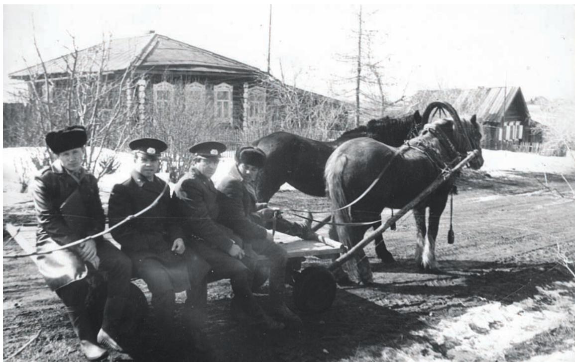
Это было давно. Следственно-оперативная группа отправляется к месту преступления

Эксперты-криминалисты по обслуживанию Верхнесалдинского отдела внутренних дел вписали свою страничку в историю криминалистики. В данной публикации назовем имена экспертов салдинской милиции и полиции.