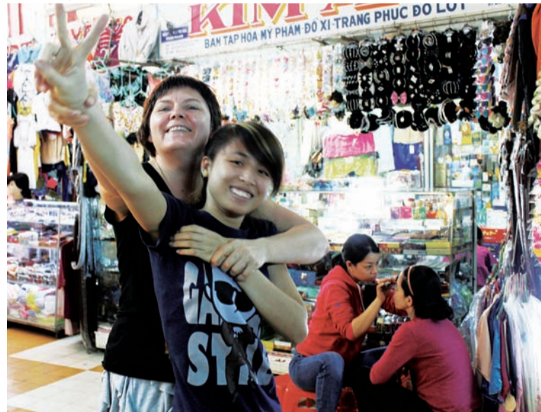
Девушка шла за мной по-пятам и, хихикая, щипала

ЖЕМЧУЖНЫЕ УКРАШЕНИЯ. Их можно купить везде, начиная с пляжа и заканчивая дорогими специализированными магазинами. Соответственно колеблется и цена. Главное – не купить подделку. Причем подделка может быть и в дорогом магазине. Благо, что моя подруга в этом разбирается, и мы купили недорогой и настоящий жемчуг. Вообще, жемчуг – благородный, чистый, нежный и живой – всегда был овеян множеством легенд. История его началась около трех тысяч лет назад в древнем Китае, где жемчуг дарили в подарок императорам, министрам и их женам. В отличие от других драгоценных камней, жемчуг не требует огранки или полировки – его сразу вставляют в оправу.