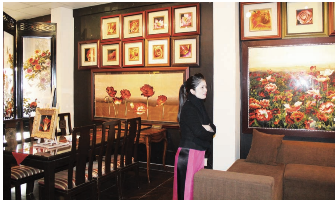
Картины, вышитые шелком (ощущение, как будто они освещены солнцем)

чужных ферм помещают устриц в специальные проволочные клетки и надежно привязывают их к кло-