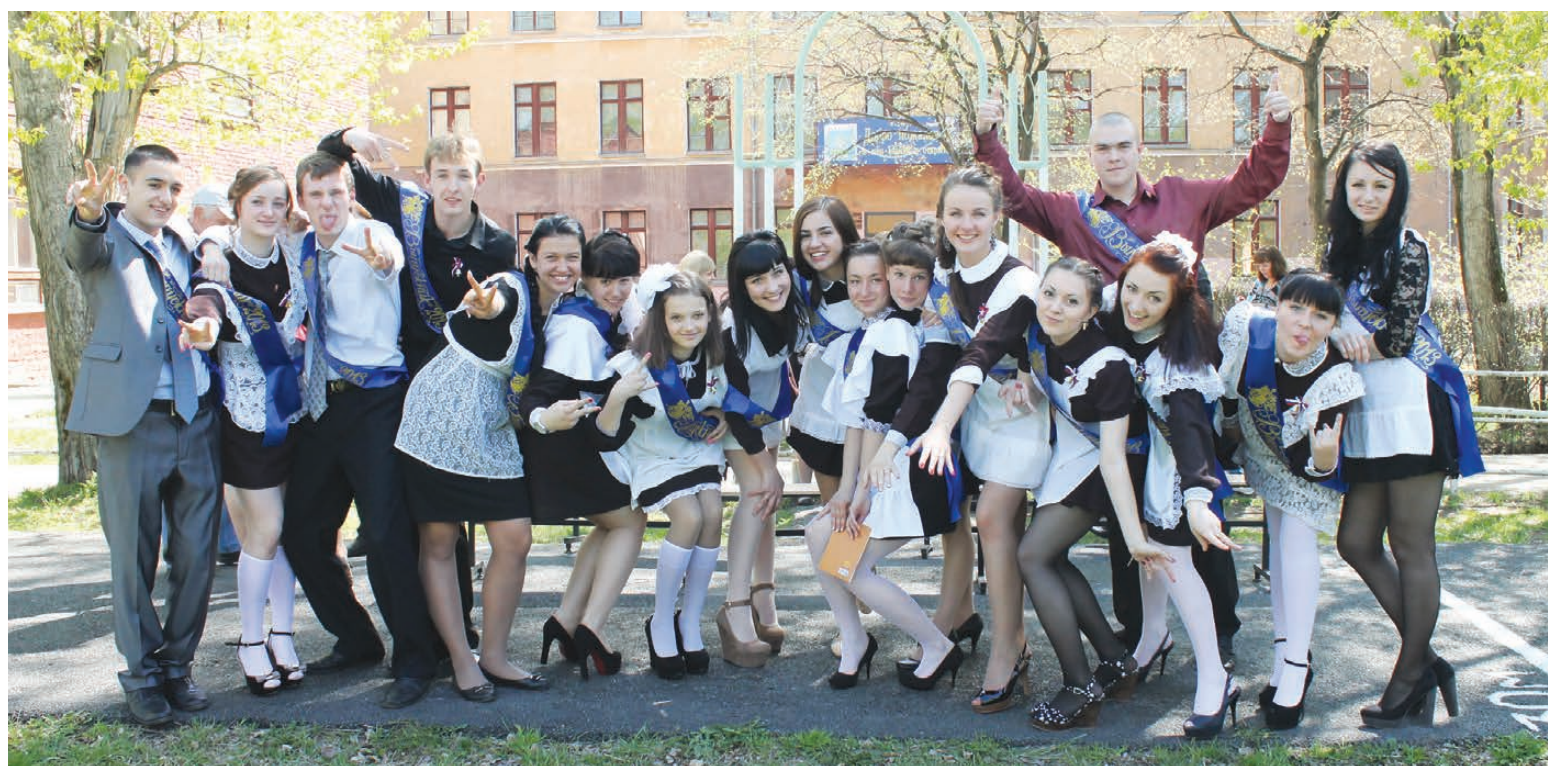
Выпускники школы № 3 счастливы вместе