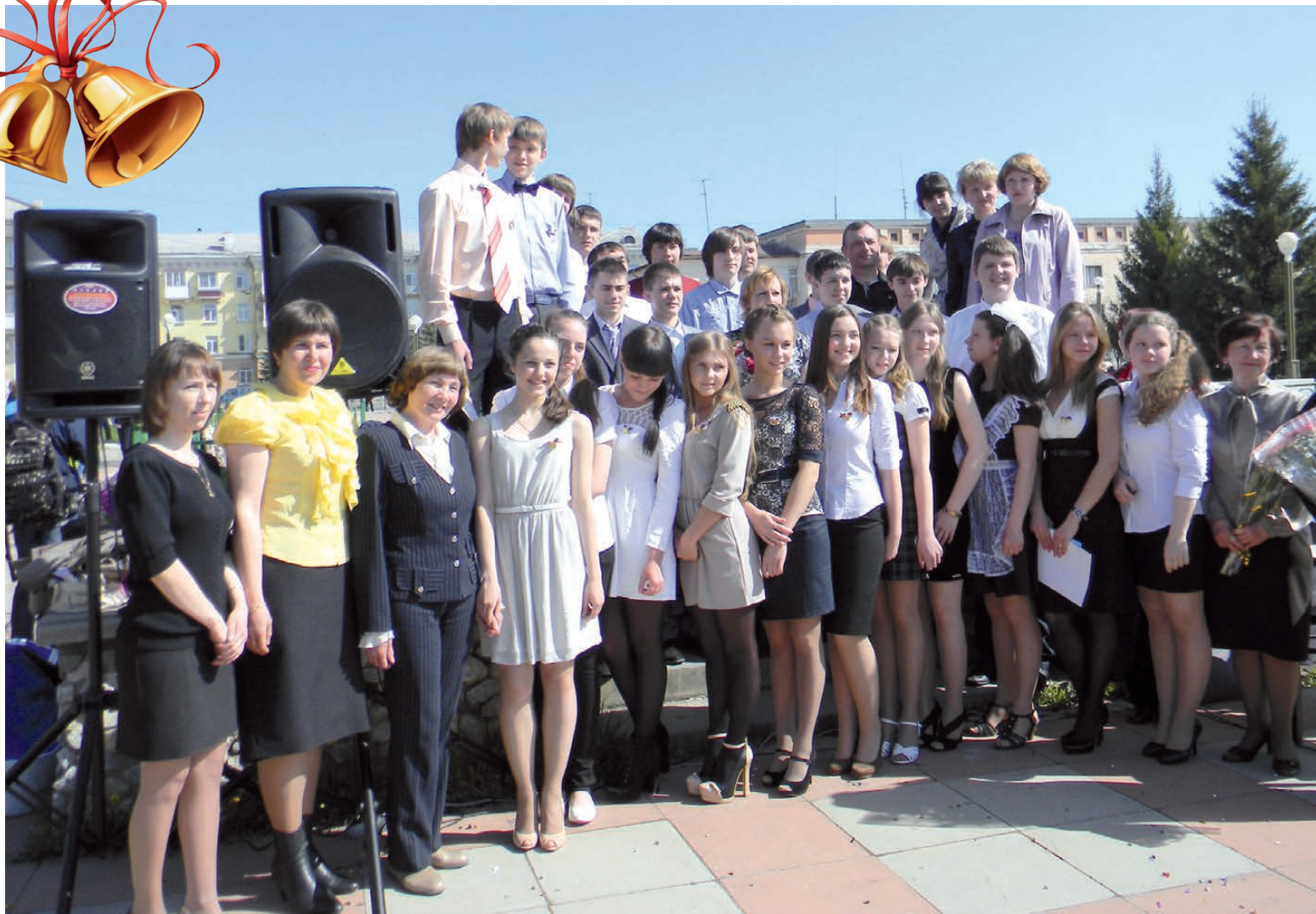
Снимок на память