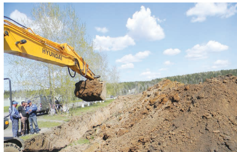
По ул. Парковой тянут газопровод к «Титановой долине»