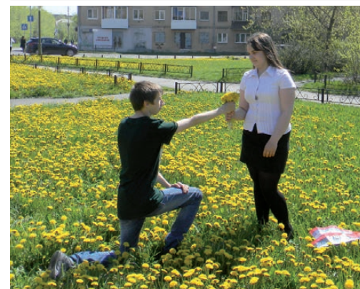
Широкий жест признания