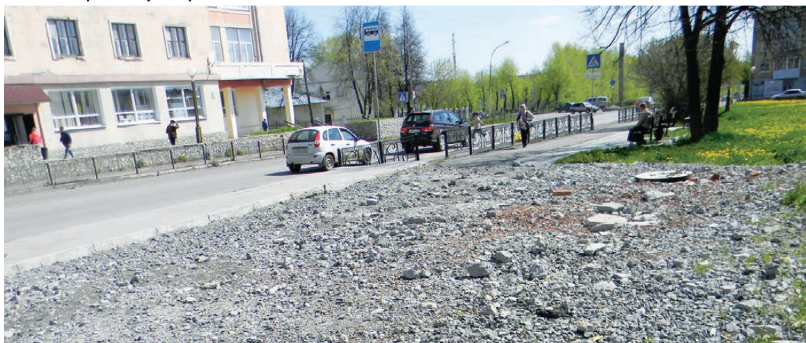
На месте павильона – куча щебня

В конце мая установились теплые дни, правда, с проливными дождями. На улицах города стало несколько оживленней: бригады УЖКХ заняты ямочным ремонтом дорог, специалисты по гидроиспытаниям городских магистралей и подготовке их к предстоящему отопительному сезону работают на трассах тепло- и водоснабжения, дворники метут и чистят территорию на своих участках. Устраняются аварии в местах прорыва водоводов – за 40-50 лет трубы настолько прогнили, что не выдерживают допустимого при испытаниях давления. Ежегодное «латание дыр» вместо замены новыми трубами больших участков теплотрассы руководители коммунальной службы объясняют ограниченными возможностями в денежных средствах. В таких слу-