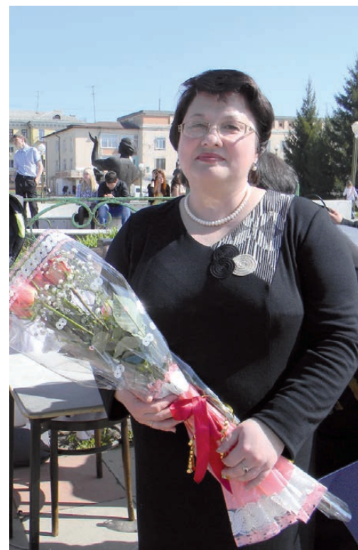
Цветы директору от выпускников