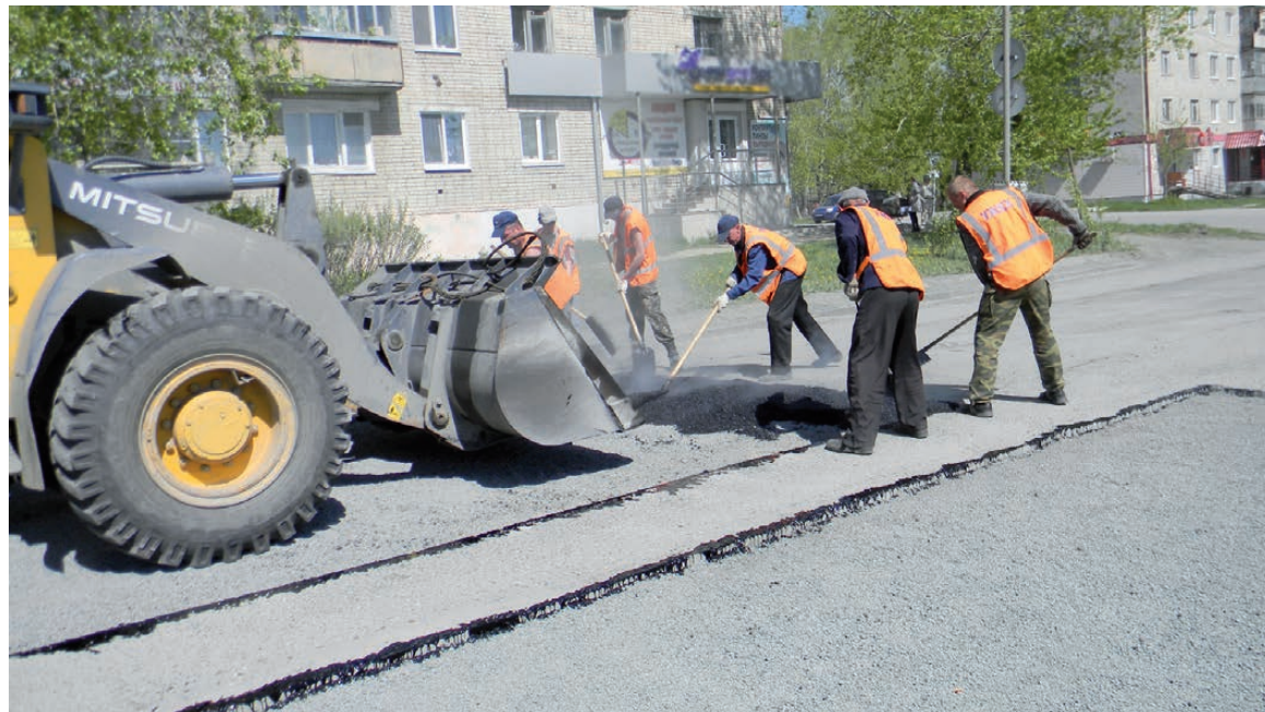
Ремонт дороги на ул. Воронова