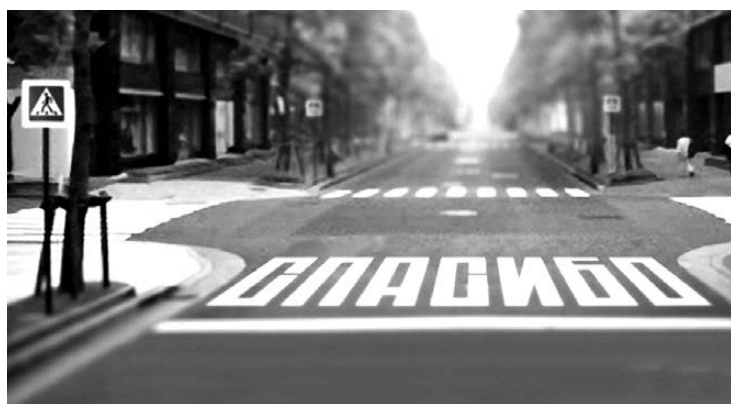
УВАЖАЕМЫЕ УЧАСТНИКИ ДОРОЖНОГО ДВИЖЕНИЯ!

Учитывая сложившуюся дорожно - транспортную обстановку и состояние дорожного травматизма среди пешеходов, на территории Верхнесалдинского городского округа и городского округа Нижняя Салда организовано и будет проводиться с 12 по 15 февраля 2013 года профилактическая операция «Пешеход. Пешеходный переход». Основными целями и задачами операции является пресечение, предупреждение, выявление и профилактика нарушения Правил дорожного движения как со стороны водителей, так и со стороны пешеходов. Все принимаемые меры будут направлены на сокращение числа жертв, среди пешеходов и обеспечение соблюдения ПДД всех категорий участников дорожного движения.