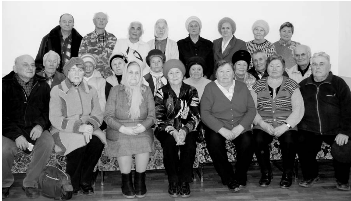
30 октября 2012 года бывшие дети Ишимского поселка впервые встретились вместе

В большой дружной семье Плесовских росли три девочки и