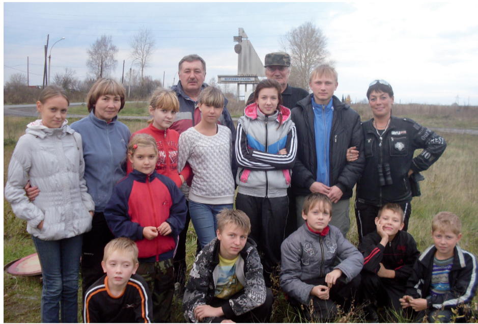
Перед выездом на соревнования

Деем позже в Н.Тагиле, на лыжной базе «Спартак», состоялось закрытие летнего сезона по спортивному ори-