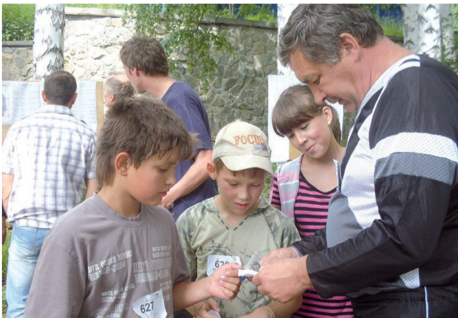
Наставления юным ориентировщикам перед стартом