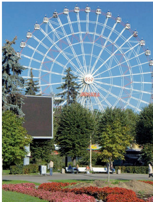
Самое высокое колесо обозрения в России (ВДНХ)