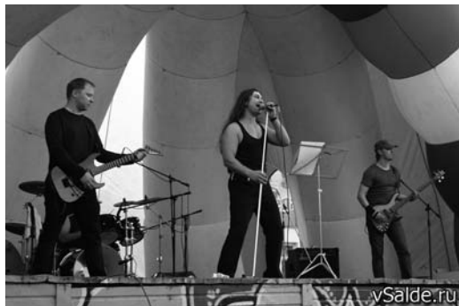
«Тротил» на сцене

лей знакомы друг с другом. Это, несомненно, умножало выплеск их энергии исполнителям, те, подпитанные этой энергией, с еще большим вдохновением и творческим порывом несли свои музыкальные композиции фанатам рока.