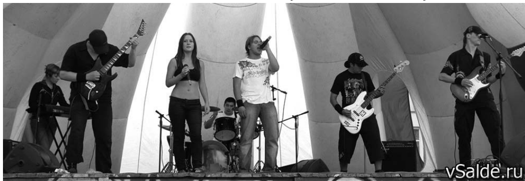
Группа «Asphyxia» в разгаре эмоций