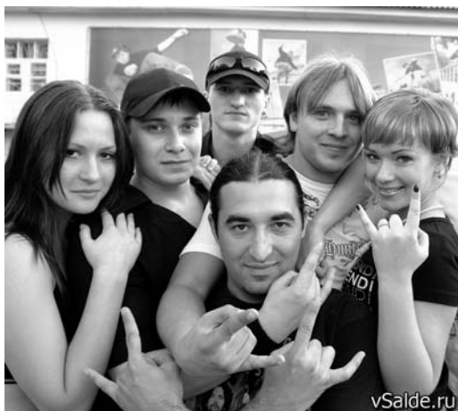
Состав группы «Asphyxia»

Поклонников тяжелого рока объединяют интерес к истории создания той или иной группы, их творческие пути и поиски, поэтому вполне естественно, что большинство зрите-