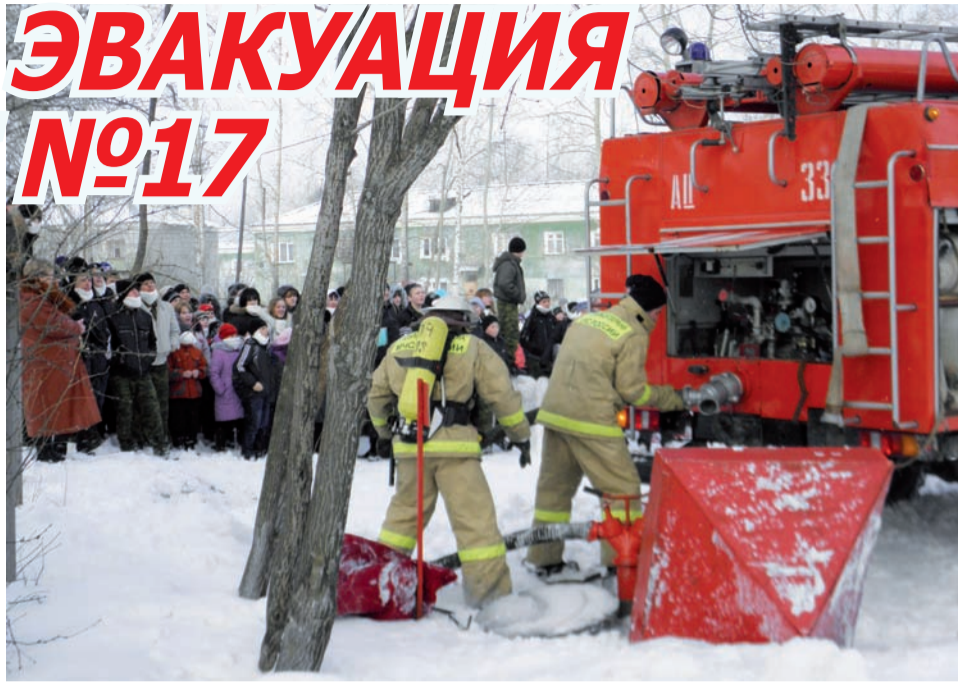
Пожарные «на объекте возгорания»

Директор вышел из школы последним. Учителя отчитались ему, что вверенные им ученики выведены из опасной зоны в полном составе. Но, как говорится в русской пословице «не бывает дыма без огня». Возникший по-