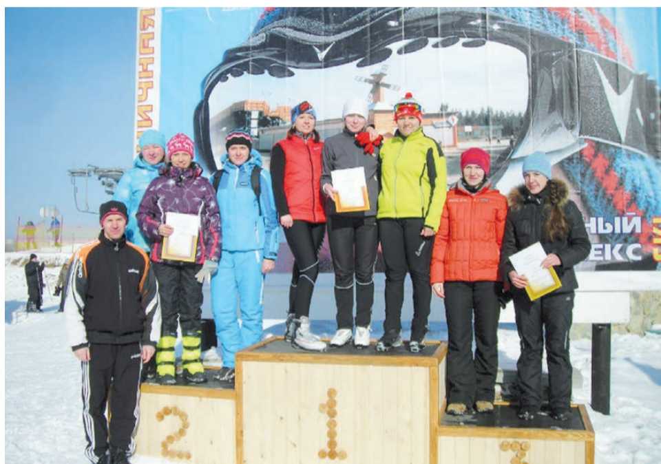
Команды призёры: у женщин 1 место - 10 цех, 2 место - 51 цех, 3 место - 32 цех