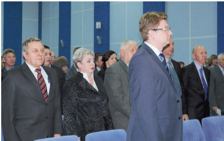
Звучит Гимн России

За работу, господа депутаты! Салдинцы ждут от вас существенных преобразований во всех сферах жизни городского округа. Не ведите избирателей, отдавших за вас свои голоса.