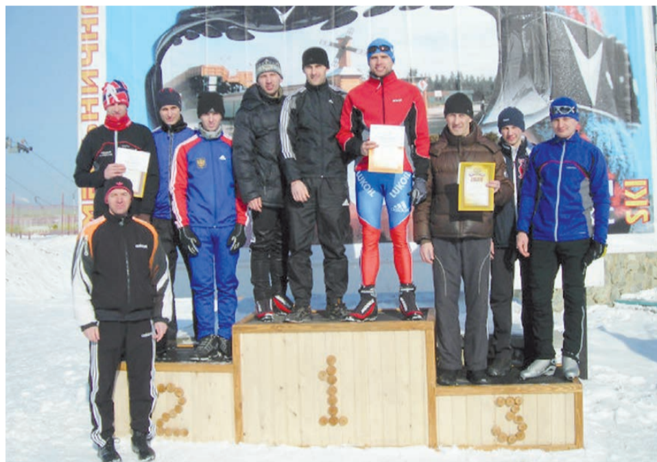
Команды призёры: у мужчин 1 место-цех 16, 2 место - 38 цех, 3 место - 32 цех