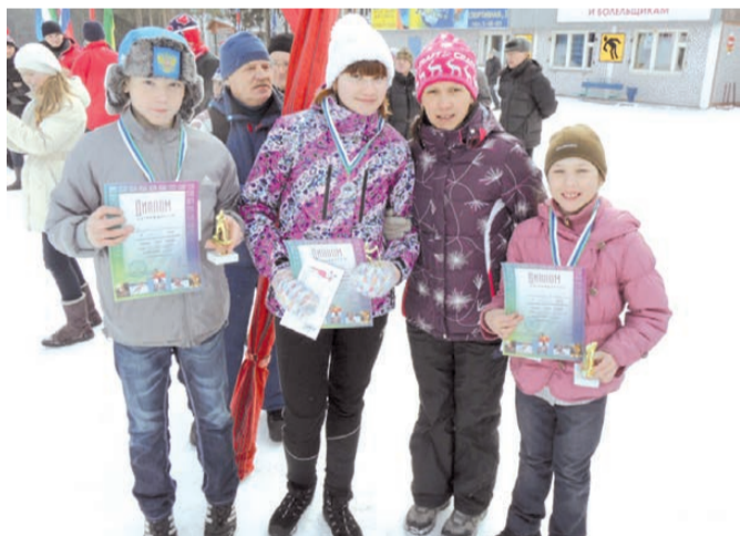
Аня с тренером и друзьями по лыжной секции