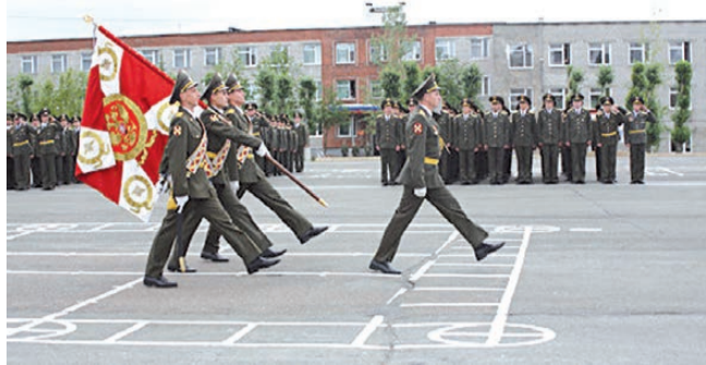
Пермский военный институт ВВ МВД России

Во все века силой, способной объединить и сохранить нашу землю, оставались Вооруженные Силы.