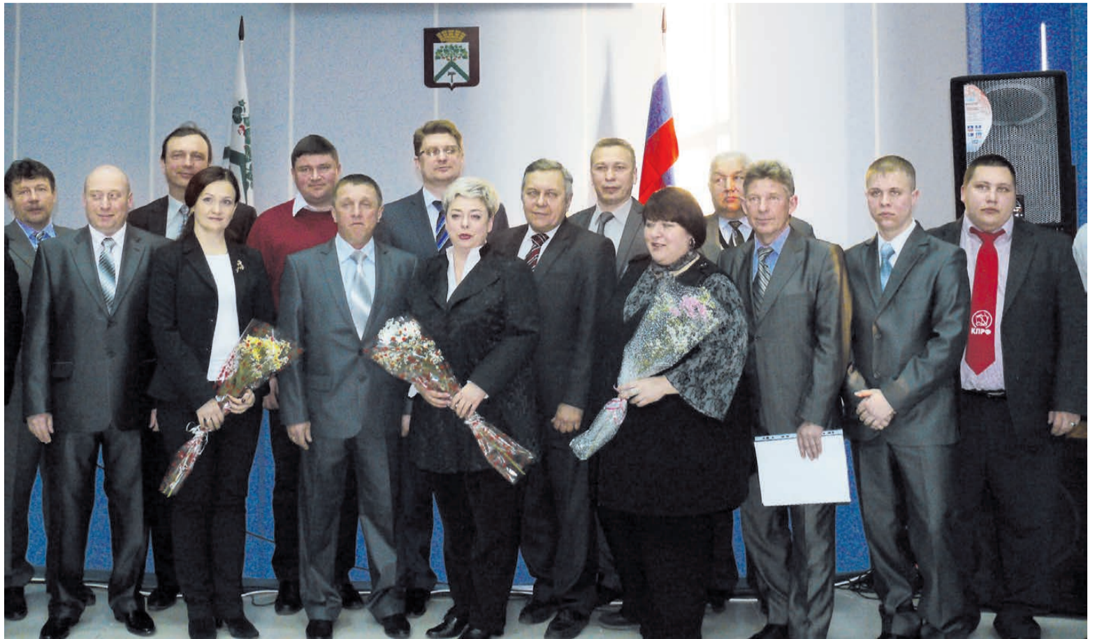
Новый состав Думы городского округа после вручения депутатских удостоверений

Подготовку и проведение выборов осуществляли Верхнесалдинская районная территориальная избирательная