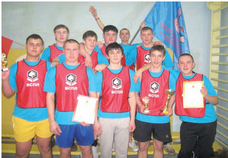
21 февраля 2012 года. Нижний Тагил.