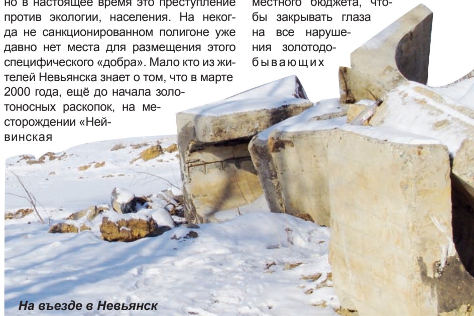
На въезде в Невьянск

россыпь» (на его территории находится пос. Холмистый) по инициативе администрации МО «Невьянский район» в рамках договора о развитии инфраструктуры территории МО «Невьянский район» артель старателей «Нейва» приняла на себя обязательство о долевом участии в проведении инженерно-геологических изысканий в Невьянском районе с целью выбора участков, пригодных для размещения промышленных и бытовых отходов. А ведь до окончания срока аренды земельного участка с золотоносной россыпью «Нейвинская» и обязательств по договору осталось менее года. Не окажемся ли мы в очередной раз в положении, когда спросить за несоответствующее исполнение должностных обязанностей, за невыполненные договорные условия будет не у кого. Нередко возникают ситуации, когда вновь избранное руководство администрации затрудняется с ответом на тот или иной вопрос, как правило, ссылаясь на халатность и некомпетентность предыдущей команды. В результате мы сталкиваемся с тем, что не знаем, в какую инстанцию обратиться далее, а возникшие проблемы не решаются. Остаётся лишь вспоминать название зарубежного фильма «Истина где-то рядом». Безответным останется вопрос: как же вы собираетесь исправлять, мягко говоря, эти недоработки? На природоохранные мероприятия Программа социально - экономического развития Невьянского городского округа на 2012 - 2014 года предусматривает не такое уж большое финансирование из местного бюджета, чтобы закрывать глаза на все нарушения золотодобывающих