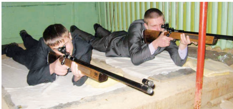
Участники соревнований по стрельбе из малокалиберной винтовки, учащиеся группы 107, на огневом рубеже

девочек 202 (крановщицы), которые специально к конкурсу даже форму подготовили. Ребята и девчонки показали высокие навыки в строевой подготовке, разучили и исполнили строевые песни.