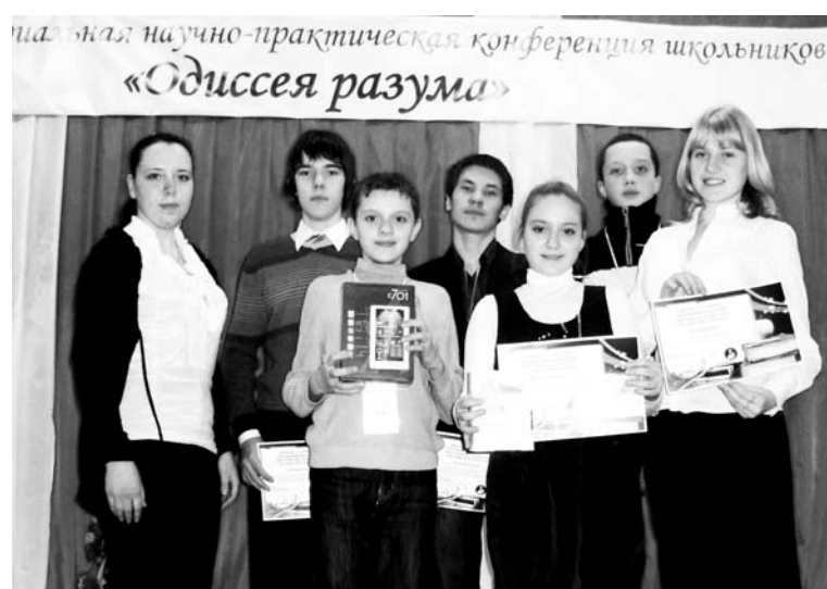
Участники I Межтерриториальной научно-практической конференции «Одиссея разума»

В силу своих интересов эти ребята только прикоснулись к науке, к исследовательским работам. Как знать, может, придет время и кто-то из них сделает величайшее откры-