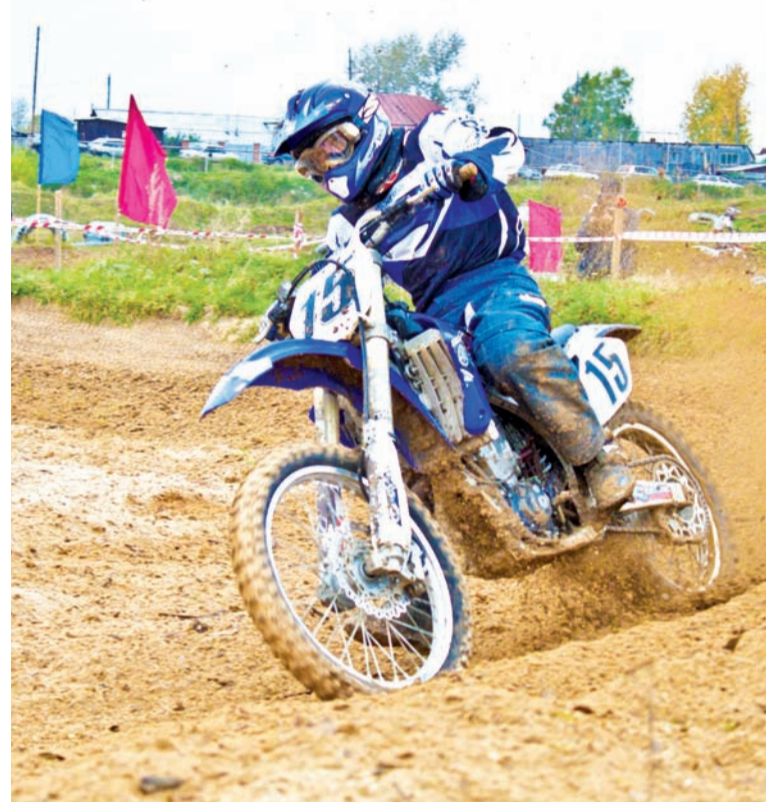
Позади - крутой поворот