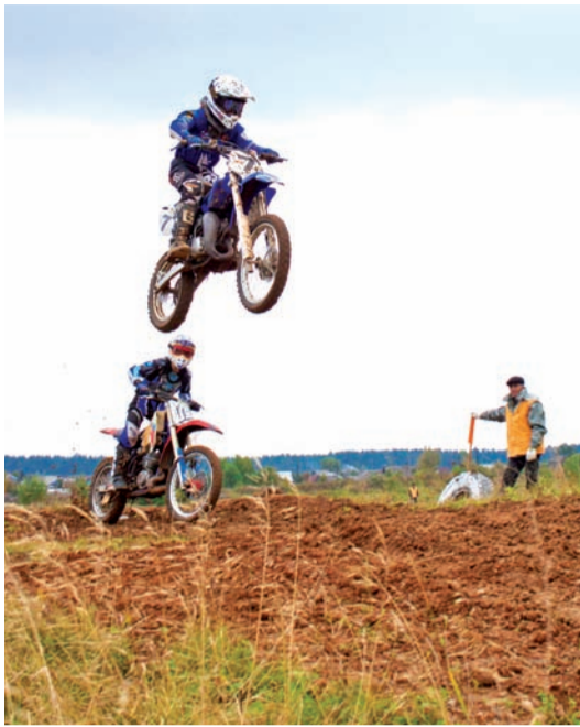
Красиво. Не правда ли?