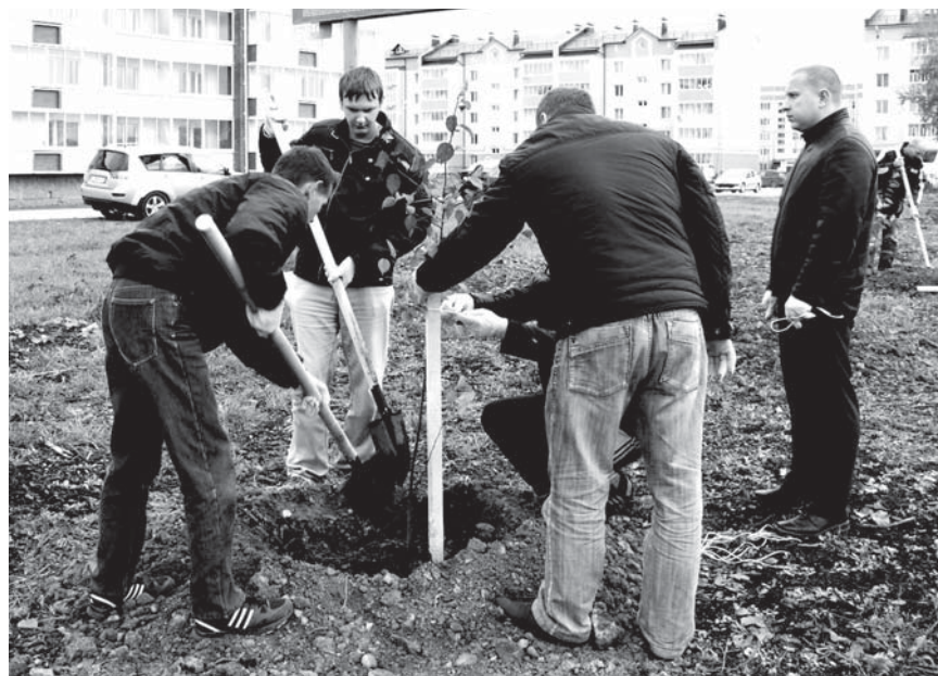
Дружный мужской коллектив быстро справляется с работой