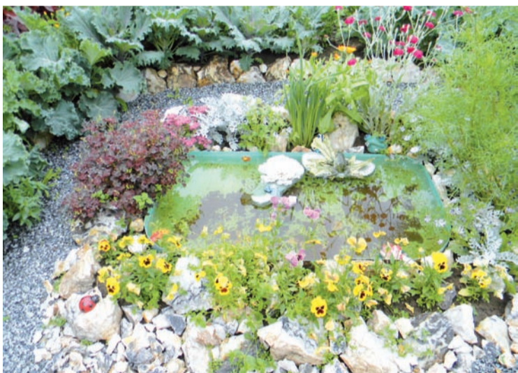
Прудик с жабами