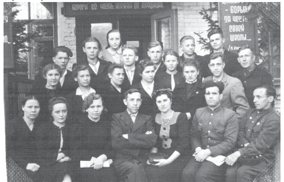
Выпуск шк. №1 им. А.С. Пушкина. 1946 год.

выпускница 1948 г. школы №1 им. А.С. Пушкина.