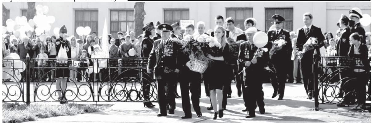
Возложение венков к памятнику заводчанам

ное настроение собравшимся на многотысячный митинг, посвященный празднованию Дня Победы.