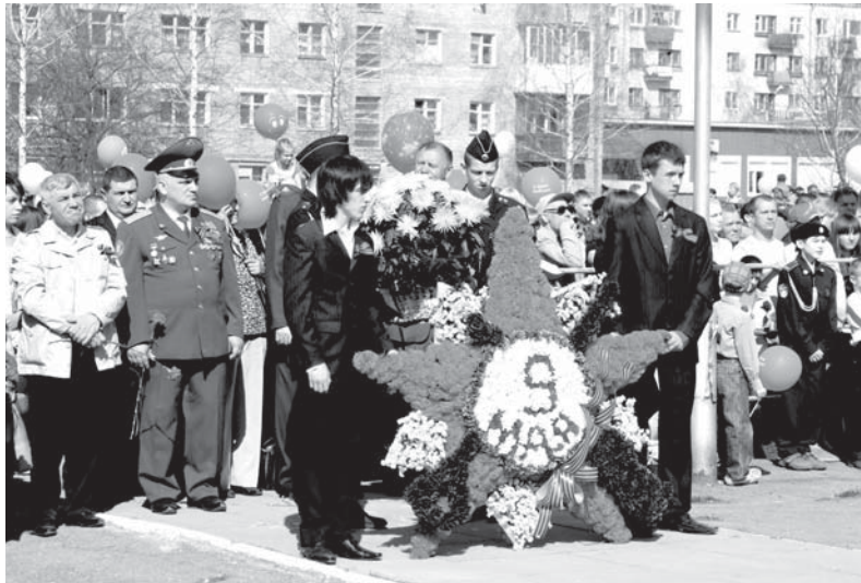
У Мемориала павшим в годы Великой Отечественной войны

В ремя не властно над памятью и подвигом советского народа в Великой Отечественной войне. Шестьдесят шесть лет минуло с того исторического дня 9 мая 1945 года, когда смолк гул орудий, треск пулеметных и автоматных очередей, пронзительный вой пикирующих самолетов, и воцарилась тишина над нашей страной и освобожденной Европой. С тех пор Девятое мая стал великим Праздником Победы. Ежегодно в этот день мы чествуем ветеранов войны, отдаем дань памяти павшим в боях за Родину.