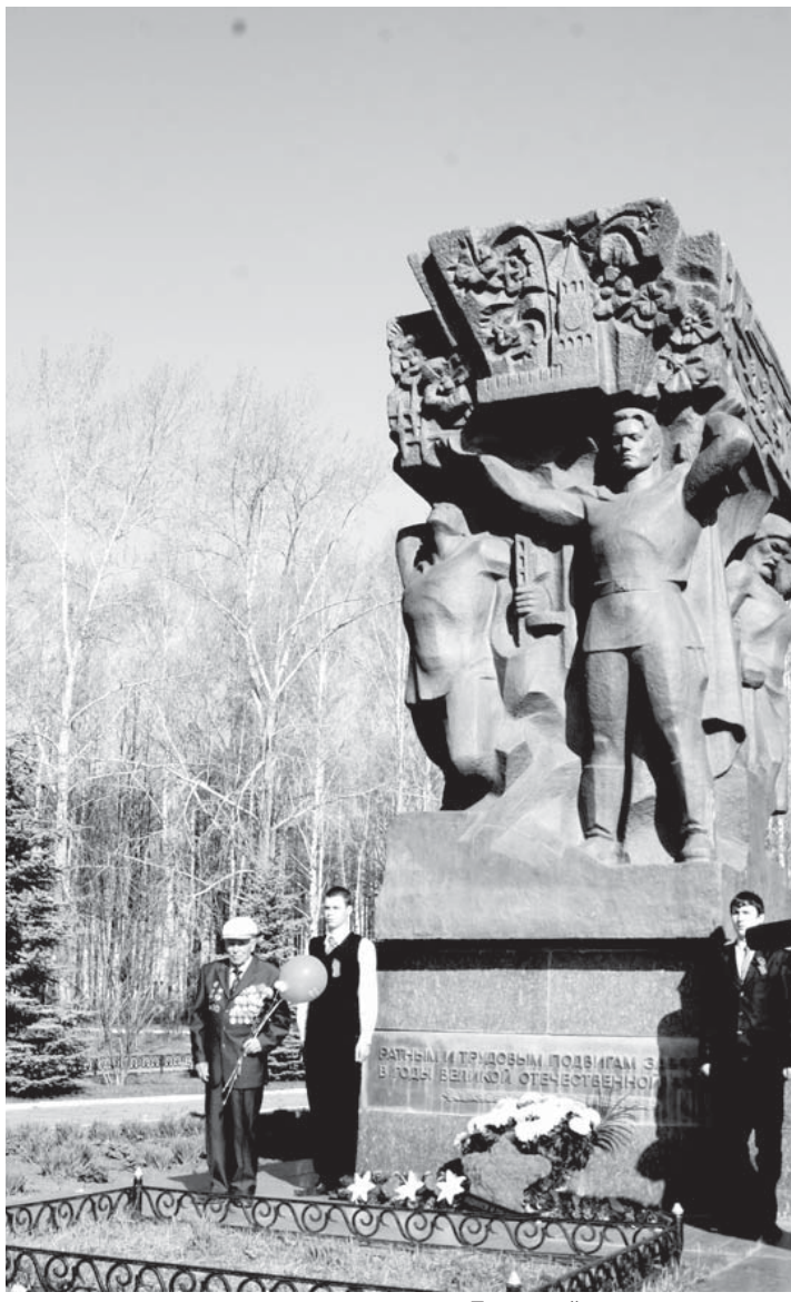
Почетный караул у памятника