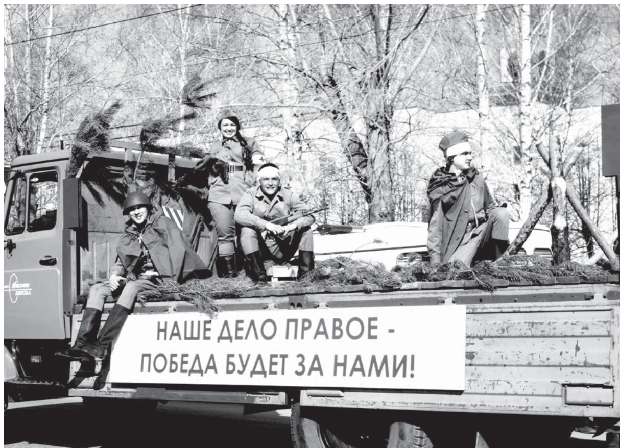
Лозунг времен войны «Наше дело правое - победа будет за нами!»