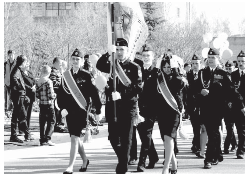
Кадеты в праздничной колонне

Литературно-музыкальная композиция в исполнении творческого коллектива Дворца культуры им. Г.Д. Агаркова доносила до присутствующих трагические и героические страницы истории великого подвига советского народа в годы Великой Отечественной войны. Возложение цветов и венков к Мемориалу, минута молчания, чеканный шаг кадетских взводов из городских школ (№9 и 17), взмывшие ввысь воздушные шары, ликование собравшихся, слезы на глазах ветеранов, концерт художественной самодеятельности - все создавало радост-