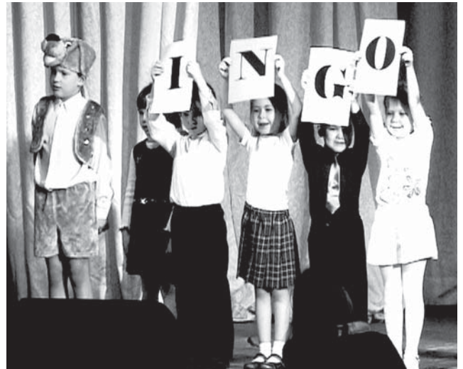
Активное участие в конкурсе приняли ребята младшего возраста

- Они могут не знать языка, но обязательно должны понимать и чувствовать то, что хотят