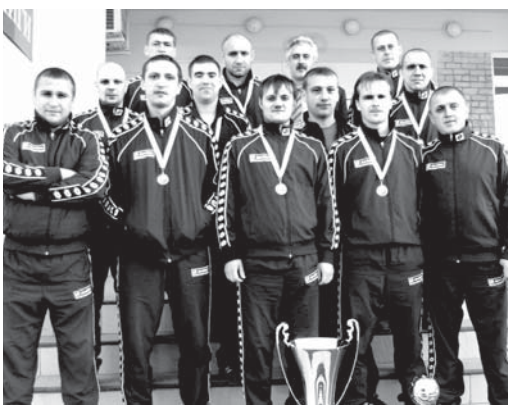
Футбольная команда «Титан»

19 марта состоялся традиционный турнир по футболу среди авиационных предприятий Свердловской области.