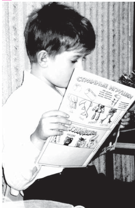
Читая детскую книжку