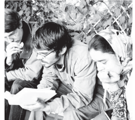
Молодежь с удовольствием читает православные книги

Умная книга формирует в человеке нравственное начало, которое помогает человеку не сбиться с жизненного пути. Сколько сейчас публикуется замечательных православных книг! Для детей – сказки, книги о православной вере, детские молитвословы, раскраски, и все очень красочно оформлены... Для молодежи и взрослых – творения святых отцов, назидательные книги современных проповедников, разнообразные учебники по Закону Божию, истории Церкви, богословию, богослужению, толкования на Священное Писание, книги о воспитании детей, жития святых, интересные художественные произведения... Такие книги – это духовная пища, необходимая для укрепления ума и души. Каждая прочитанная хорошая, добрая книга для человека, это как чистый свежий лесной воздух после загазованного города, как теплый летний дождь, омывающий потускневшие стекла окон. Поэто-