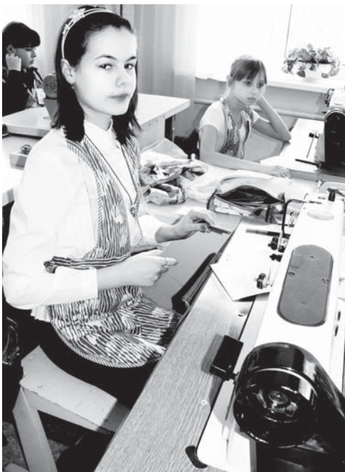
Участница выполняет задание

11 февраля в межшкольном учебном комбинате собрались шестиклассницы, чтобы показать свои умения и навыки, участвуя в конкурсе «Сама себе мастерица». По условиям от каждой школы разрешалось по две представительницы - претендентки на звание лучшей швеи. Таким образом, получилось 12 участниц.